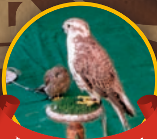
Exhibición de rapaces