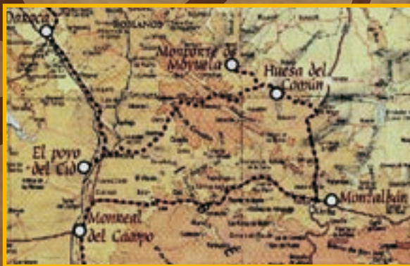
Montalbán, Camino del Cid.

Juglares Caballeros Mercado Fuegos Danzas