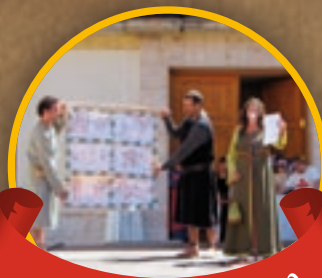
Romance de Ciego