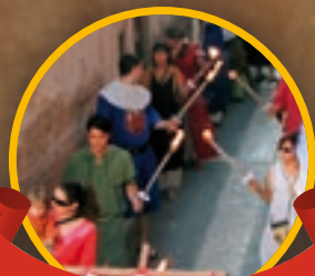
Desfile de antorchas

Exposición de artesanía popular (Torreón de la Cárcel)